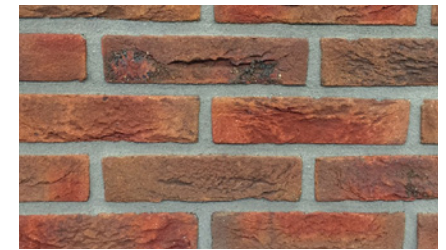
Rood nuance (basis)